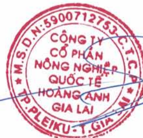
Nguyễn Xuân Thắng